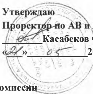
ГРАФИК РАБОТЫ Государственной аттестационной комиссии по приему государственного экзамена по специальности 5В090100- «Организация перевозок, движения и эксплуатация транспорта» Образовательная программа: «Организация перевозок на воздушном транспорте» по профилирующей дисциплине: «Обеспечение безопасности движения на транспорте»