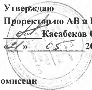
ГРАФИК РАБОТЫ Государственной аттестационной комиссии по приему государственного экзамена по специальности 5В090100- «Организация перевозок, движения и эксплуатация транспорта» Образовательная программа: «Организация перевозок на воздушном транспорте» по профилирующей дисциплине: «Основы грузовой и коммерческой работы»