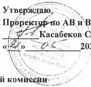
ГРАФИК РАБОТЫ Государственной аттестационной комиссии по приему государственного экзамена по специальности 5В090100- «Организация перевозок, движения и эксплуатация транспорта» Образовательная программа: «Организация перевозок на воздушном транспорте» по профилирующей дисциплине: «Обеспечение безопасности движения на транспорте»