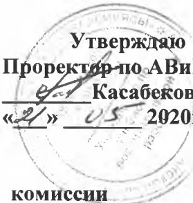
ГРАФИК РАБОТЫ Государственной аттестационной комиссии по приему государственного экзамена по специальности 5В071400-«Авиационная техника и технологии» образовательная программа: «Авиационная безопасность» по профилирующей дисциплине «Конструкция ЛА»